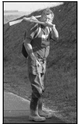
Een van de 'Zeven Dwergen'

Complete stukken jura-zeebodem verdwenen in de geduldige bus van H el ene, die tot overmaat van luxe tot aan de