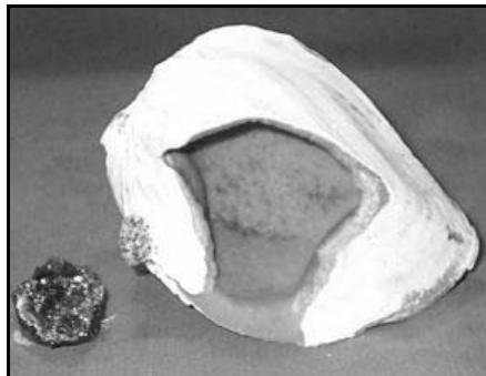
Schelp omgezet in Rhodochrosiet als vorm van mineralisatie

resten van levende wezens en planten die miljoenen jaren geleden al verdwenen zijn. Er moeten dus omstandigheden en situaties zijn waardoor deze voor verval behoed zijn. We moeten ons eerst realiseren dat het fossiel wat we in onze handen hebben dan wel lijkt op het oorspronkelijke organisme, maar in werkelijkheid heeft het huidige materiaal niets met het oorspronkelijke te maken. De vorm is behouden, de materie zelf is vervangen door iets anders wat de tand des tijd wel heeft kunnen doorstaan.