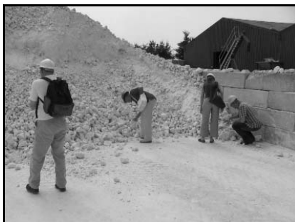
Het 'opraperen' en 'meenemen' van handstukken was onderdeel van de excursie