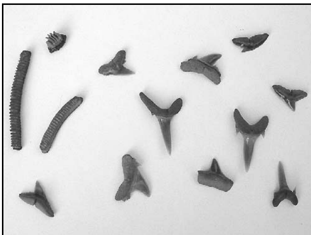
Een greep uit de vondsten

Onderin de groeve komen in het kleipakket plaatselijk dunne zandlaagjes voor met schelpengruis en kokerwormen. De haaietandjes en -tanden kunnen vooral in deze laagjes worden gevonden. Plaatselijk kunnen deze laagjes verdikt zijn tot lenzen die dan zelfs grote hoeveelheden tanden bevatten. Door