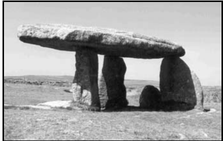
Lezing: Langs stenen erfenissen

In de tabel op deze pagina ziet u een opsomming van alle kringmiddagen in chronologische volgorde met daarbij de