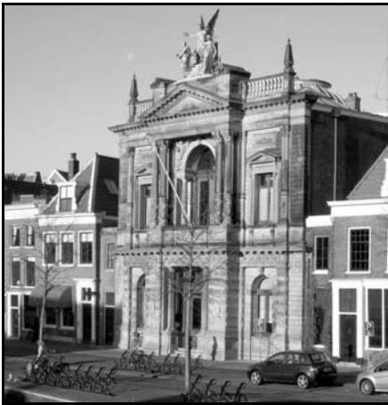
Dit monumentale gebouw herbergt het Teylers Museum.

Voor deze dag hadden zich maar liefst zesentwintig deelnemers opgegeven. Onderling werd driftig gecarpoold en om 10.00 uur was iedereen onder de