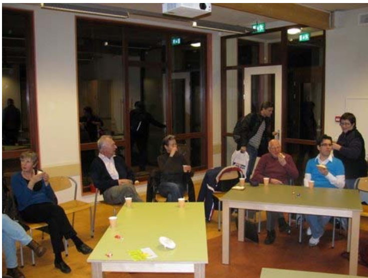
Een indruk van de nieuwe locatie.....