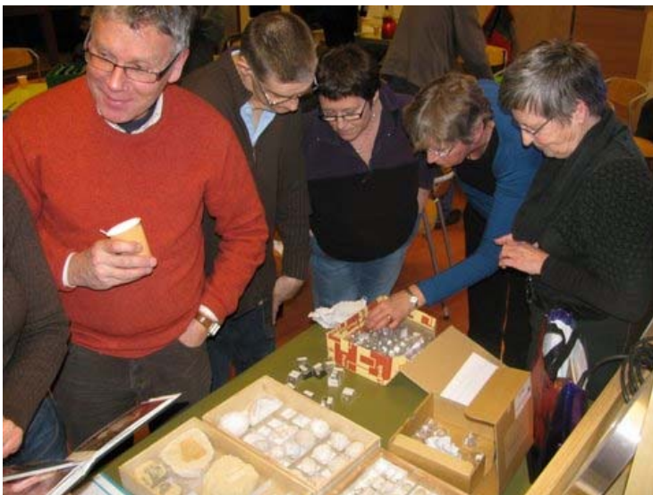
En het bleef nog lang gezellig.....