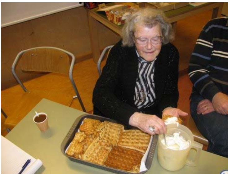
Wil voorziet iedereen van een toef slagroom op de wafel.....