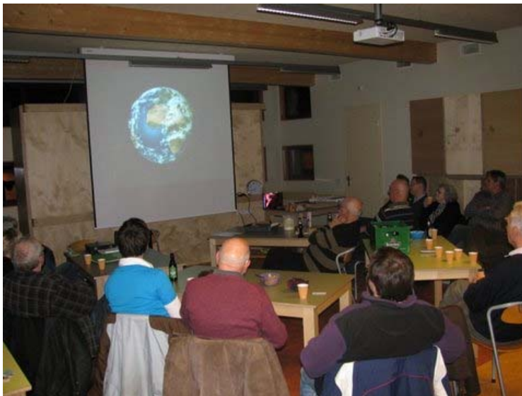
Een film over vulkanen; verzorgd door John Bastiaansen.....