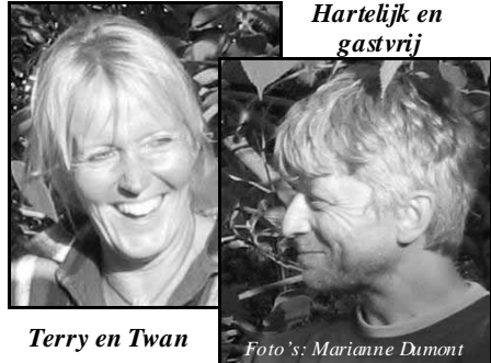
Hartelijk en gastvrij