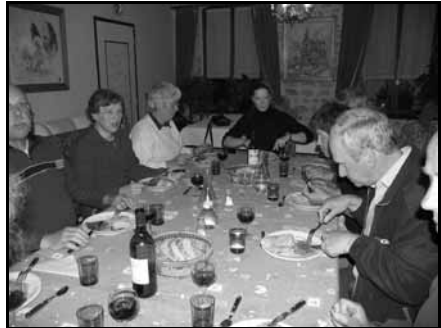
Alle dagen werden afgesloten met een zeer uitgebreid diner