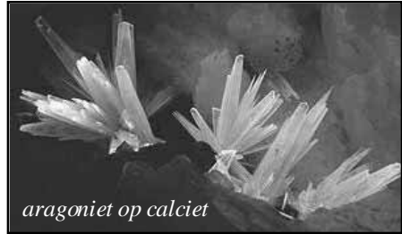
aragoniet op calciet