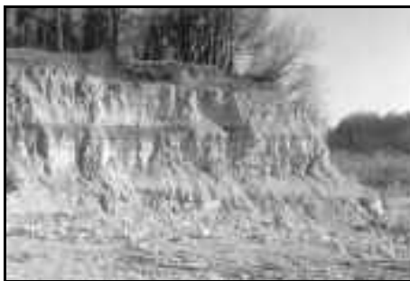
De Winterswijkse Steen- en Kalkgroeve (Onder-Muschelkalk)